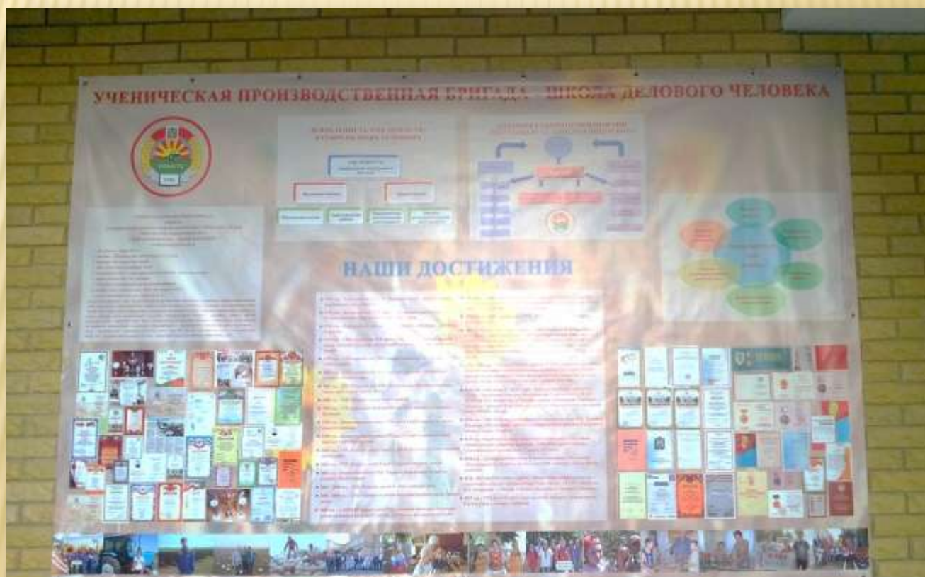
Банер «УПБ «Юность» - школа делового человека»

Сегодня вопросы трудового обучения и воспитания подрастающего поколения весьма актуальны, от их решения во многом зависит не только будущее детского трудового движения, но и будущее села, района, края, России.